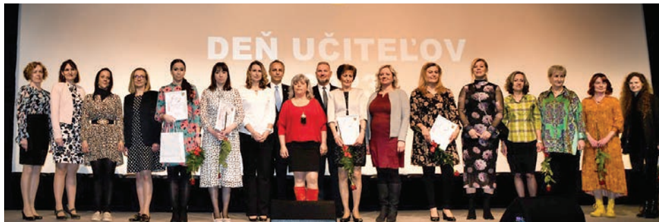
Mesto ocenilo celkom 18 učiteliek zo škôl sídliacich v Pezinku

Dvadsiaty ôsmy marec už tradične patrí Dňu učiteľov. Vedenie mesta im v tento deň poďakovalo za ich neúnavnú a obetavú prácu na slávnostnom udeľovaní ocenení, ktoré tento rok získalo 18 pedagógov.