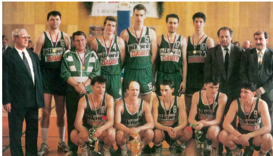
BK DAVAY PEZINOK – MAJSTER SLOVENSKA 1993