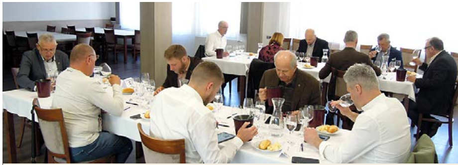
Pri hodnotení vín panuje sústredenie a ticho.

Každý rok sa na tomto podujatí predstavuje verejnosti to najlepšie, čo sa urodí a spracuje pod Malými Karpatmi, ale aj na celom Slovensku. A či sa víno vydarí, je okrem snahy a kumštu vinára predovšetkým zásluha prírody. Jarné mrazy aj krupobitie sa nášmu regiónu vyhli. Minulý rok bol zvláštny tým, že prakticky od jari až do septembra takmer nepršalo a teplota bola ako v subtropoch. Starým vinohradom, ktoré majú koreňový systém hlboko pod zemou, to až tak neprekážalo, ale mladé výsadby trpeli. Aj napriek tomu bola úroda dobrá. Menšie kyseliny v muštoch sa zachraňovali skorším zberom úrody. A v septembri prišiel zlom – dážď. Vtedy už vinohradník očakáva suché a slnečné obdobie, a tak začali preteky s počasím. Kto stihne obrať úrodu pred chorobami, vyhrá. Podarilo sa.