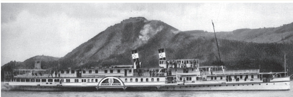
Parník Kráľovná Alžbeta, na ktorom slovenskí židia opúšťali v lete 1939 Slovensko