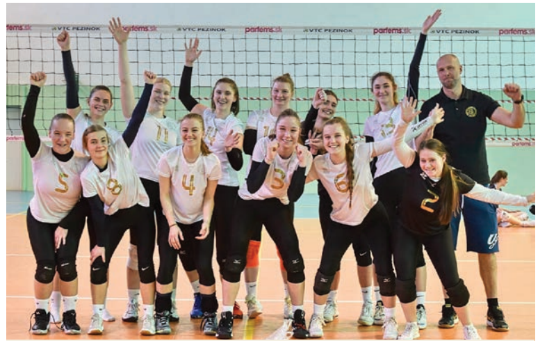
Juniorské volejbalistky ŠVK Pezinok sa prebojovali na Majstrovstvá Slovenska, ktoré sa budú konať 6. – 8. mája v Skalici.