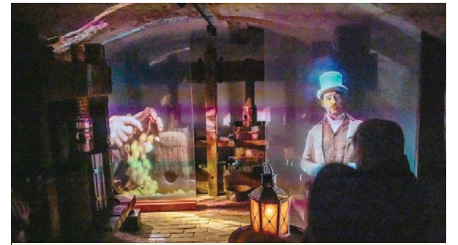
Klárin lis je súčasťou stálej expozície múzea

„Snažíme sa aj touto formou prezentácie ukázať, že moderná expozícia môže byť ozajstným divadlom dejín a zážitkom, o ktorom budú návštevníci radi rozprávať. Použité multimedialne technológie poukazujú na to, že za každým vystaveným predmetom stoja konkrétne