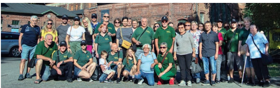
Členovia Malokarpatského baníckeho spolku na Fajronte v Ostrave

FAJRONT, 27. setkání hornických měst a obcí, sa konalo v Ostrave v dňoch 8. až 10. septembra. Severomoravskú metropolu pri tejto príležitosti navštívilo 800 členov zo 65 baníckych spolkov z Českej, Slovenskej a Poľskej republiky. Malokarpatský banícky spolok, ako už tradične, patrila medzi najpočetnejšie zastúpené spolky.