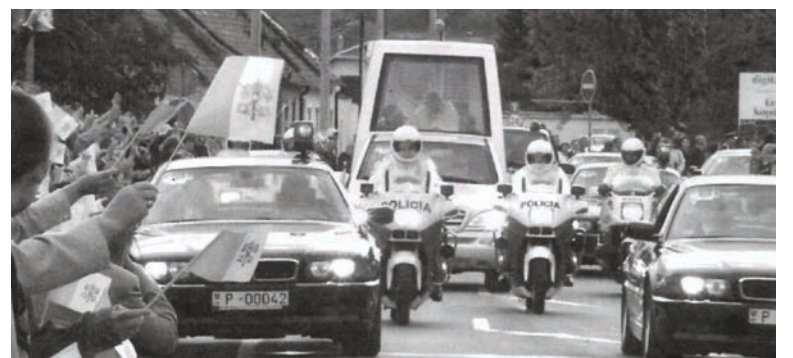
Fotografia z Pezinčana č. 10/2003 zachytávajúca papamobil so Svätým Otcem v sprievode policajných vozidiel