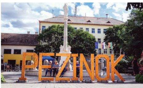
Trojrozmerný nápis bol novinkou