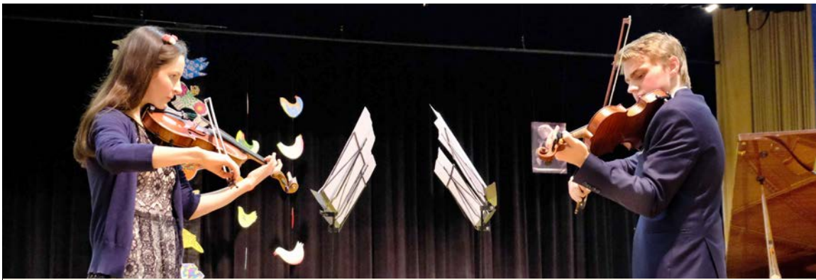
Festivalové koncerty sa budú konať v spoločenskej sále Domu kultúry

Už po štrnásty raz sa stretnú na Festivale Eugena Suchoňa mladí interpreti z celého Slovenska – víťazi celoštátnych, ale aj medzinárodných interpretačných súťaží základných umeleckých škôl, aby svojím umením vzdali poctu významnému peziňskému rodákovi, hudobnému skladateľovi Eugenovi Suchoňovi. Verejnosť z Pezinka a okolia má tak jedinečnú príležitosť vypočuť si to najlepšie, čo sa v hudobnej interpretácii žiakov ZUŠ počuť dá.