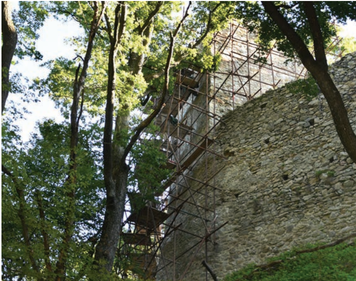
Záchrana hradu Biely Kameň pokračuje