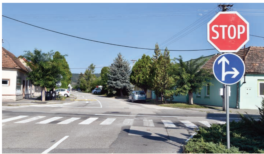
Bernolákova ulica už nie je hlavnou cestou

Začiatkom septembra nastala zmena organizácie dopravy na križovatke ulíc SNP a Bernolákova, ktorá sa týka prednosti v jazde. Ulica SNP je podľa nového dopravného značenia v celej svojej dĺžke hlavnou cestou, Bernolákova ulica vedľajšou.