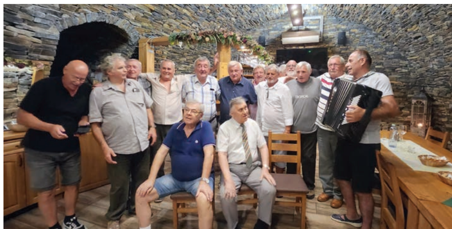
Na stretnutí v Pezinku sa zišlo 22 z 25 členov čestnej jednotky