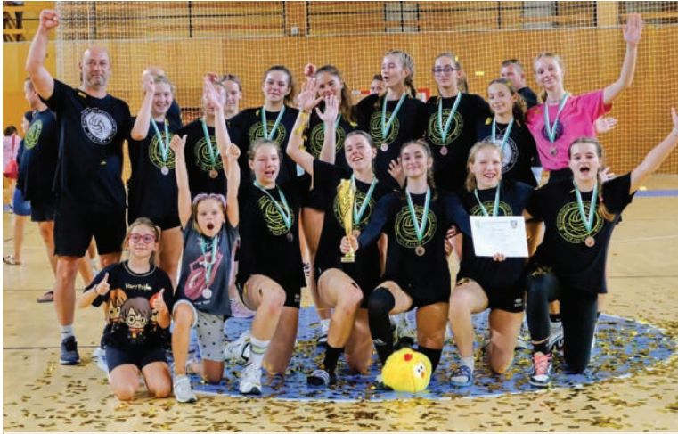
Hráčky ŠVK Pezinok vybojovali tretie miesto

Počas druhého septembrového víkendu zavítalo do Pezinka vyše dvesto volejbalistiek do 16 rokov. Na mimoriadne kvalitne obsadenom turnaji sa odohralo 56 zápasov v štyroch miestnych halách a telocvičniach.