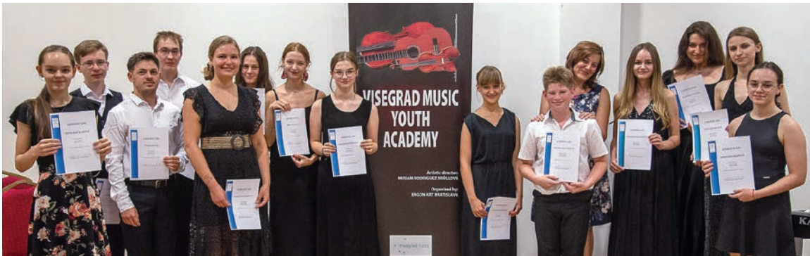
Účastníci Vyšehradskej hudobnej akadémie

Výnimočný hudobný večer zažili Peziňčania v utorok 22. augusta. Na pôde Súkromnej základnej školy Kalogatia sa stretli umelci z vyšehradského regiónu, aby svoj talent premenili na fascinujúce hudobné zážitky.