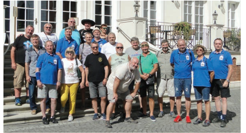
Absolventi vojenskej vysokej školy na stretnutí v Pezinku