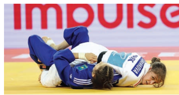
Na svetovom šampionáte v chorvátskom Záhrebe