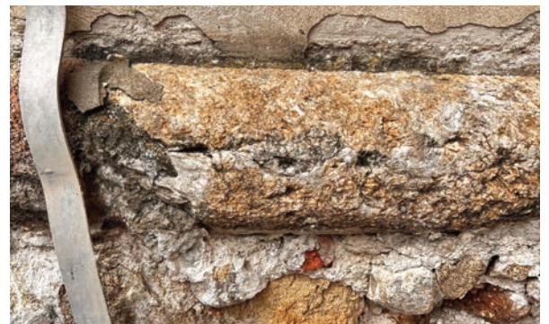
Sokel kostola Premenia pána na Radničnom námestí