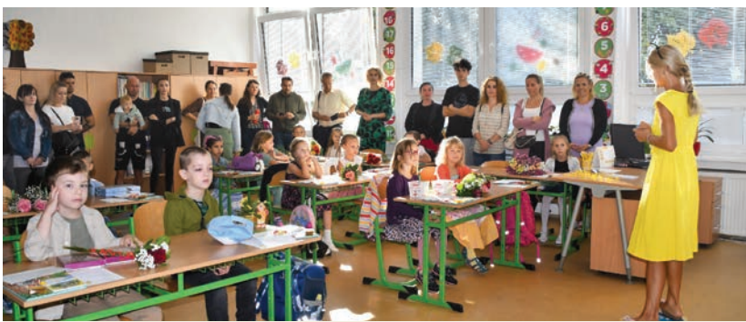
Do základných škôl nastúpilo 284 prvákov