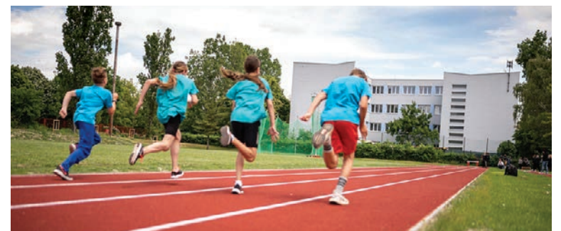
Atletický štadión v areáli Strednej športovej školy na Ostredkovej ulici

Rekonštrukcie a investičnej podpory sa dočkala aj Spojená škola v Ivanke pri Dunaji a jej pracovisko, Jazdecká škola v Zálesí. Župa tu vybudovala moderné priestorové a technologické zázemie. Plne vyhovujú požiadavkám trhu práce v oblasti pôdohospodárstva a veterinárstva. Projekt zahŕňa nové technológie pre výkrm v oblasti drobného chovu, ako aj stolárske a kovárske dielne. Technológia dodaná do objektu, ktorý bude plniť účely RTG pracoviska, zase podporí odbor veterinárne zdravotníctvo.