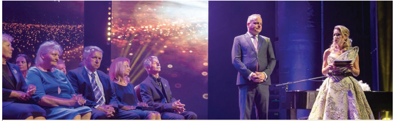
Záber z minuloročného odovzdávania ocenení