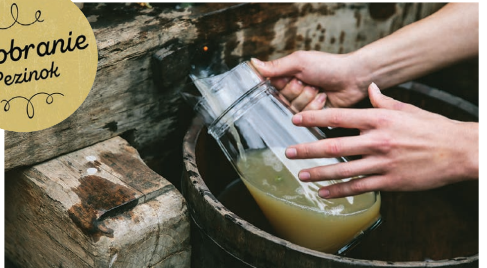
Súčasťou programu bola tradičná prešovačka