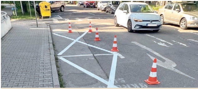
(Ne)parkovanie na chodníkoch