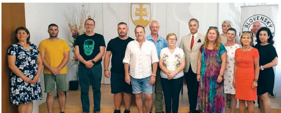
Darcovia krvi boli ocenení Kňazovického medailou a Janského plaketou

V stredu 13. septembra sa v sobášnej sieni Mestského úradu Pezinok konalo slávnostné oceňovanie darcov najvzácnejšej tekutiny. Slovenský Červený kríž - Územný spolok Bratislava-okolie poďakoval pravidelným darcom krvi z pezinského okresu.