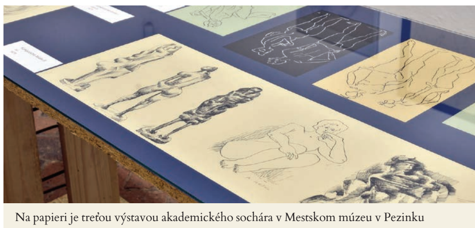
Na papieri je treťou výstavou akademického sochára v Mestskom múzeu v Pezinku

V umelcovej práci rezonujú témy materstva, rodiny, biblické i žánrové príbehy, portréty i fantastické zhmotnené postavy, abstraktné či konštruktívno-geometrické tvary. Veľké množstvo variácií, skíc a metamorfóz vzniká celkom spontánne, pričom necháva voľne plynúť líniu kontúr a obrysov.