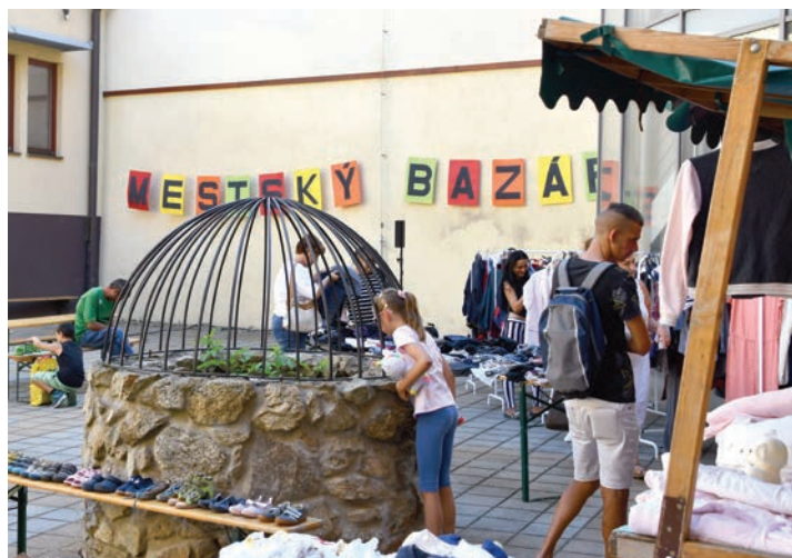
Návštevníci Mestského bazáru ocenili myšlienku pomoci a recyklácie