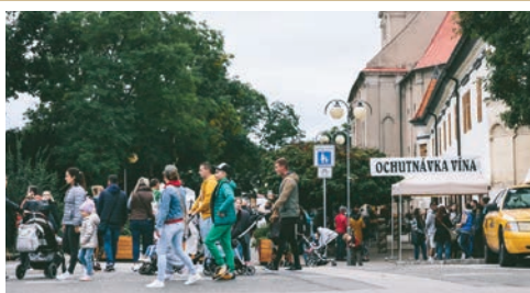
Návštevnosť bola aj tento rok vysoká