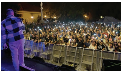
Večerné koncerty prilákali davy