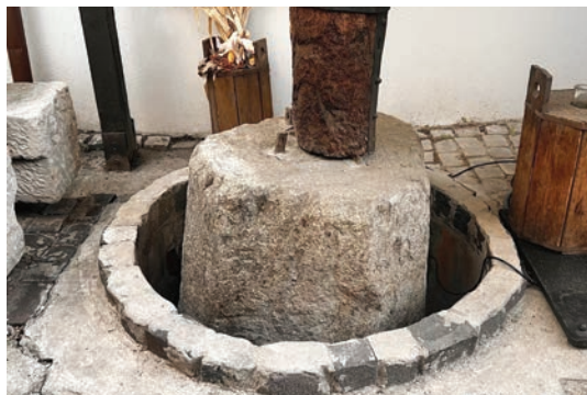
Granit slúžil, ako závažie na veľké vinohradnícke lisy

Masívna a strohá budova kostola je zdobená jednoduchým soklom. Ten je zväčša vytesaný z granitov resp. pegmatitov. Tie sa ponášajú na žuly, no majú väčšie zrná kremeňa, slúd i živcov. Tak môžeme v sokle okolo kostola pozorovať vejáriky muskovitu. V priestoroch kostola nájdete ďalšie zaujímavosti. Sväteničky pri vstupe sú zo žuly.