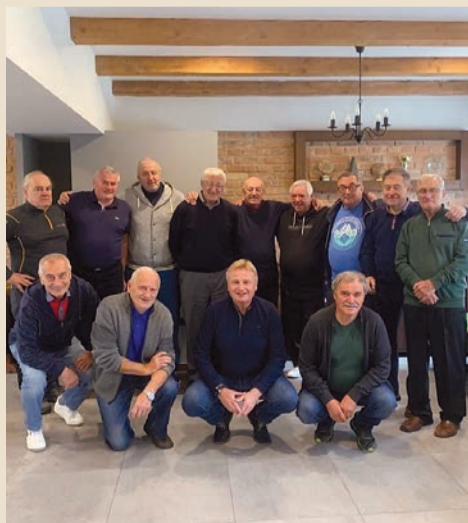
Futbalisti klubu TJ Družstevník Grinava