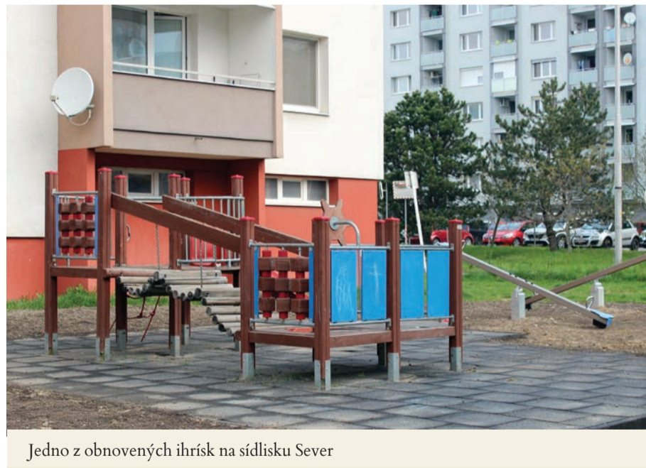
Jedno z obnovených ihrísk na sídlisku Sever

Na financovanie revitalizácie využíva vlastné a externé zdroje.