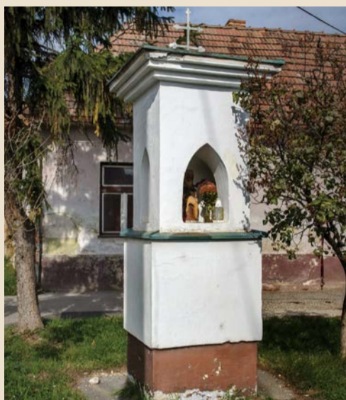
Božie muky na Bratislavskej ulici

V zozname pamätihodností mesta sú zapísané tri objekty Božích múk. Všetky boli postavené v prvej polovici 19. storočia, zaznamenalo ich aj druhé vojenské mapovanie realizované v rokoch 1819 - 1858.