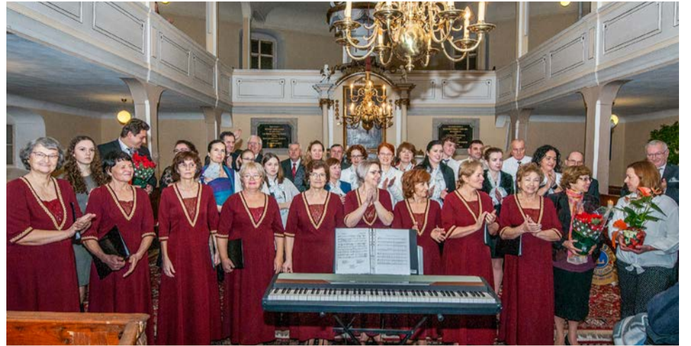
Na Adventnom benefičnom koncerte v roku 2022 vystúpili súbory Stafides a Radosť