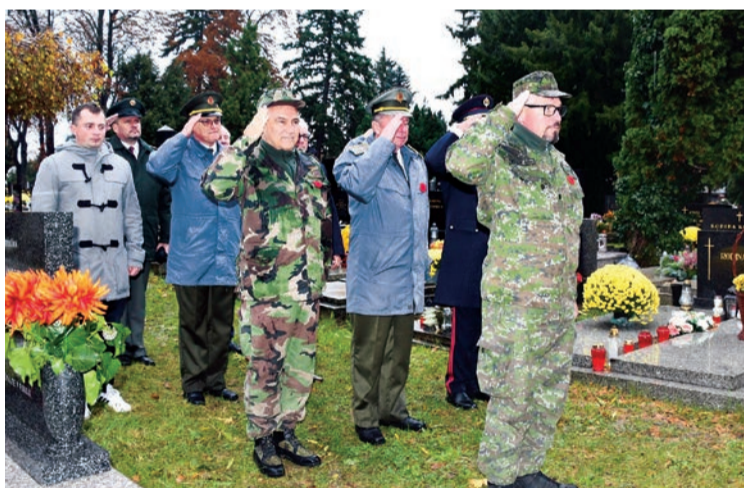
Pietny akt kladenia vencov sa konal pri viacerých pomníkoch v Pezinku