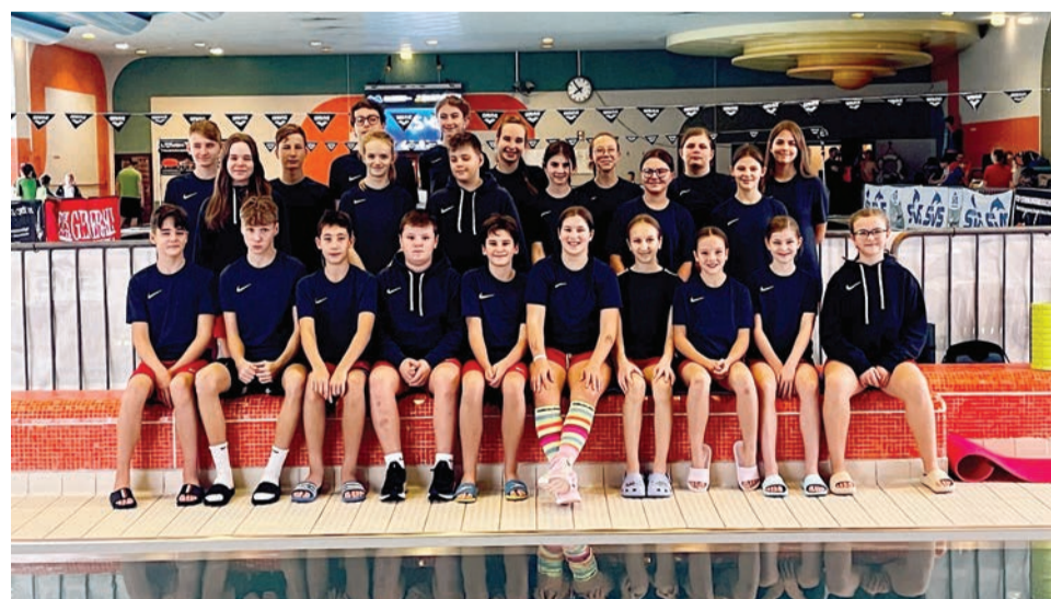
Mladší plavci vo Schwechate