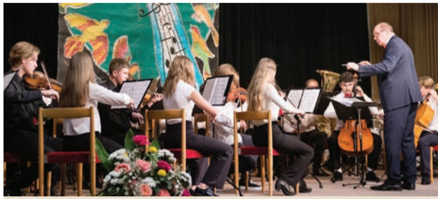
Výnimočný XIV. ročník Festivalu Eugena Suchoňa