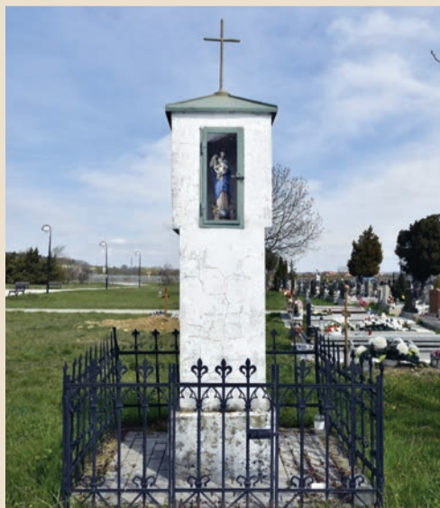
Božie muky na Cajlanskom cintoríne

Pôvodný výraz Božích múk bol jednoduchší. V nikách neboli umiestnené žiadne výjavy, murovaná architektúra bola ukončená formou ustupujúcich štvorcov vytvárajúcich malú pyramídku, dnes prekrytú keramickou krytinou.