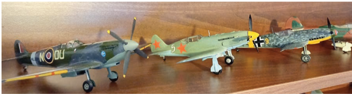
Matejovou záľubou je lepenie modelov lietadiel z druhej svetovej vojny

Text: Nina Bednáriková