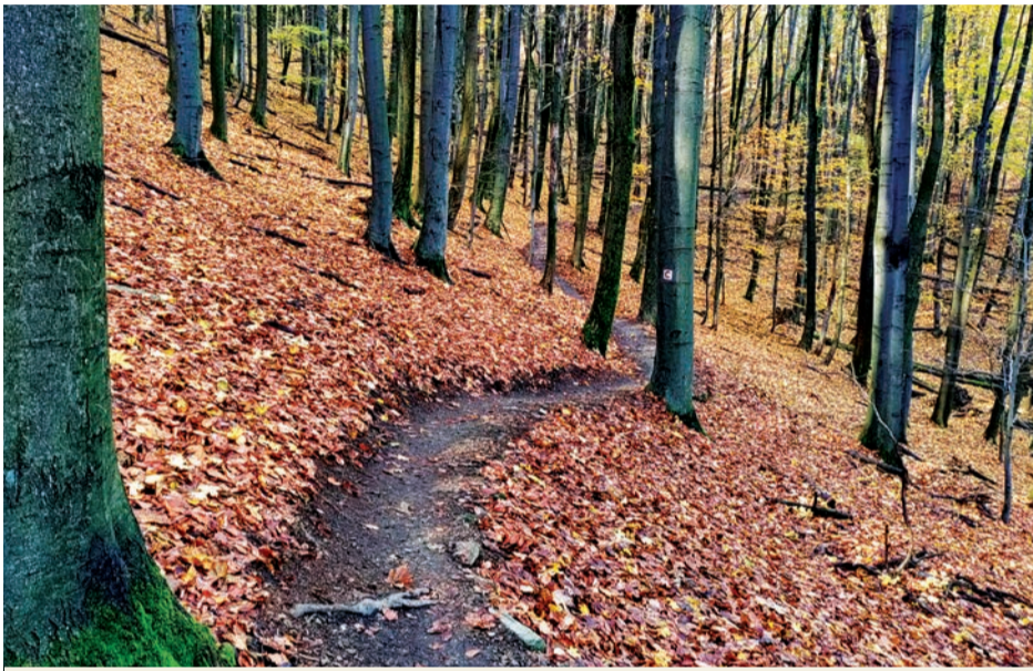
O cyklochodník pod Konskými hlavami sa starajú v každom ročnom období

V máji tohto roku privítali Pezinčania otvorenie cyklotrasy - singletracku pod Konskými hlavami. Väčšina reakcií na túto cyklotrasu je pozitívna. Vyskytlo sa aj niekoľko negatívnych vyjadrení, ktoré kritizovali náročnosť trasy.