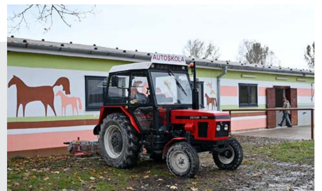
Vybavenie centra plne vyhovuje požiadavkám trhu práce v oblasti pôdohospodárstva a veterinárstva