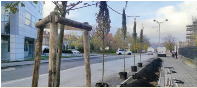
V centre pribudli nové stromy