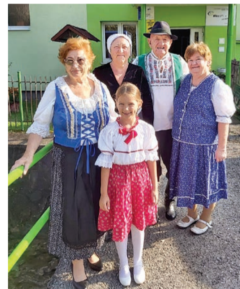
Ľudoví rozprávači na 25. ročníku súťaže