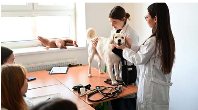
Pracovisko bude pripravovať žiakov na prácu v odboroch agropodnikanie, poľnohospodárstvo, veterinárne zdravotníctvo