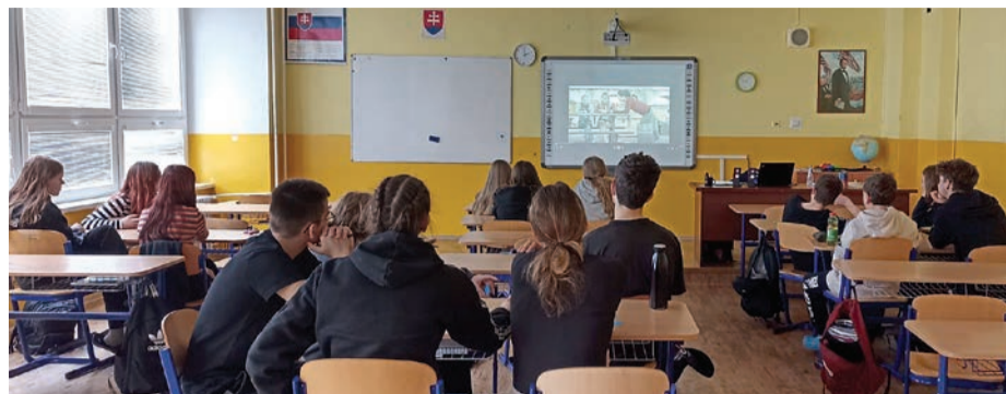
Súčasťou preventívnej činnosti sú aj prednášky pre stredoškôľakov

Eva Pilátová