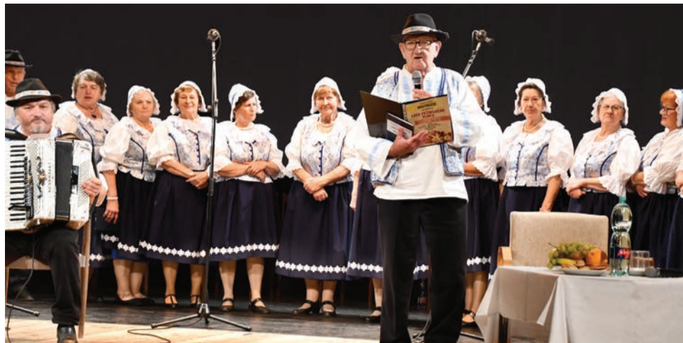
Obstrléze spája nadšencov ľudových tradícií