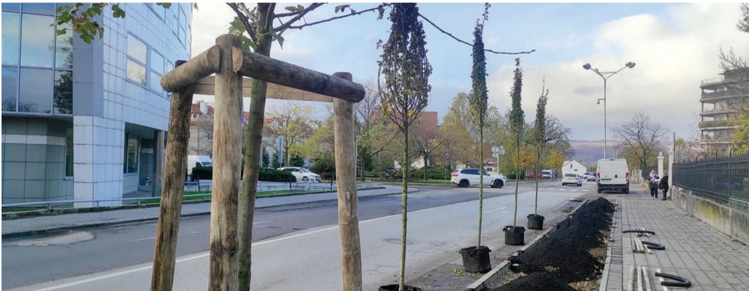
Pôvodnú výsadbu nahradili hlohy jednosemenné Stricta