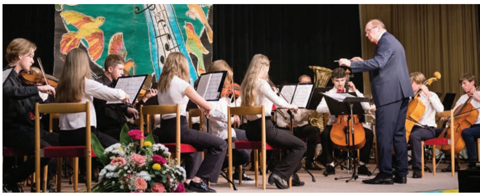
Orchester Dúbravská harmónia zo ZUŠ E. Suchoňa v Bratislave