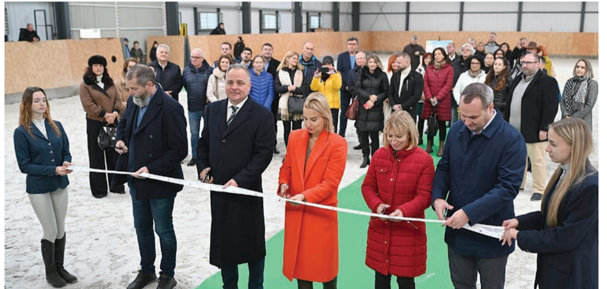
Bratislavský samosprávny kraj otvoril zmodernizované Centrum odborného vzdelávania a prípravy v Zálesí

Škola bude pripravovať žiakov na prácu v odboroch, ako sú agropodnikanie, poľnohospodárstvo či veterinárne zdravotníctvo. V roku 2018 sa Bratislavský samosprávny kraj (BSK) pustil do komplexnej rekonštrukcie a modernizácie objektov odborného a teoretického vyučovania Spojenej školy Ivanka pri Dunaji. Centrum odborného vzdelávania a prípravy (COVP) sa nachádza v Zálesí a slúžiť bude pre oblasť poľnohospodárstva a rozvoja vidieka. Areál zmenil nielen vzhľad, ale disponuje aj moderným a kvalitným materiálno-technickým vybavením.