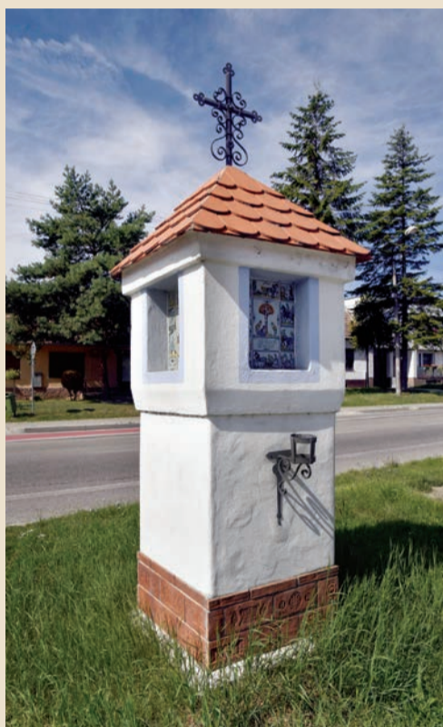
Božie muky na Kupeckého ulici

Božie muky sú obielené, v spodnej, pätkovej časti farebne oddelené bledohnedým náterom.