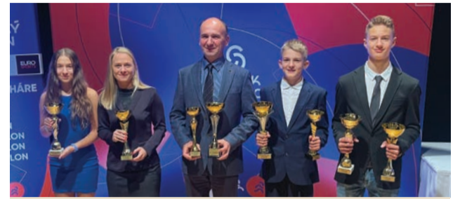
TRlgala 2023: Slávnostné ocenenie najlepších