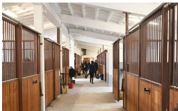
Súčasťou centra sú odborné učebne pre ustajnenie koní