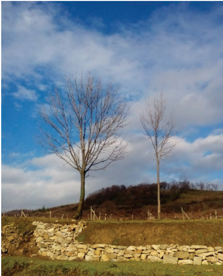
Vinári majú za sebou náročný rok

Ja som konvenčne hospodáriaci vinohradník, ktorý dodržiava obmedzenia, ekologické pestovanie hrozna, nesmiem teda robiť nadmerné chemické postreky, ale aj tak sa dá dobrá úroda dosiahnuť s piatimi, šiestimi postrekmi za rok. Ak má človek skúsenosti a nezasiahne iná vyššia moc,