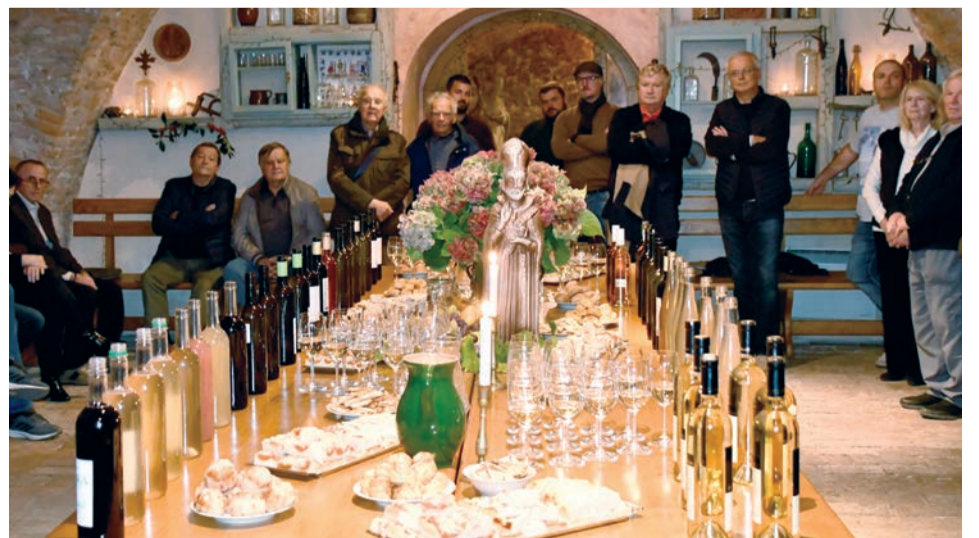
Svätomartinské požehnanie mladých vín sa tento rok konalo už po 29. raz