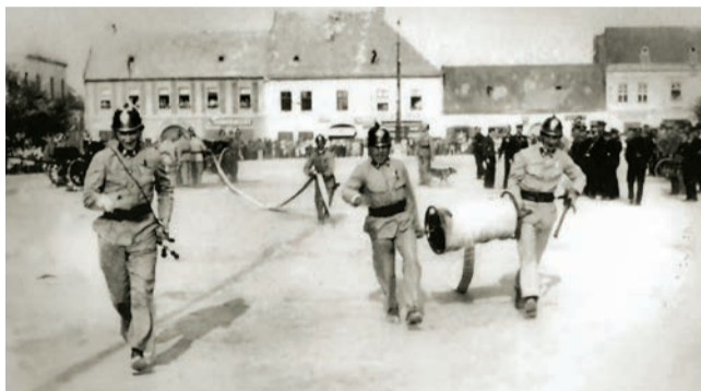
Námetové cvičenia dobrovoľných hasičov v Pezinku v dvadsiatych rokoch 20. storočia

Znie to možno neuveriteľne, ale začiatkom budúceho roka, presne 11. januára, si v Pezinku pripomenieme už stopäťdesiate výročie vzniku Dobrovoľného hasičského spolku (DHS). Je to najstaršia nepretržite fungujúca organizácia v meste. Založili ho ako jeden z prvých hasičských spolkov na území dnešného Slovenska. Úplne prvý vznikol v Bratislave (1867), o šesť rokov neskôr v Martine a Trenčíne a v roku 1874 v Ružomberku.