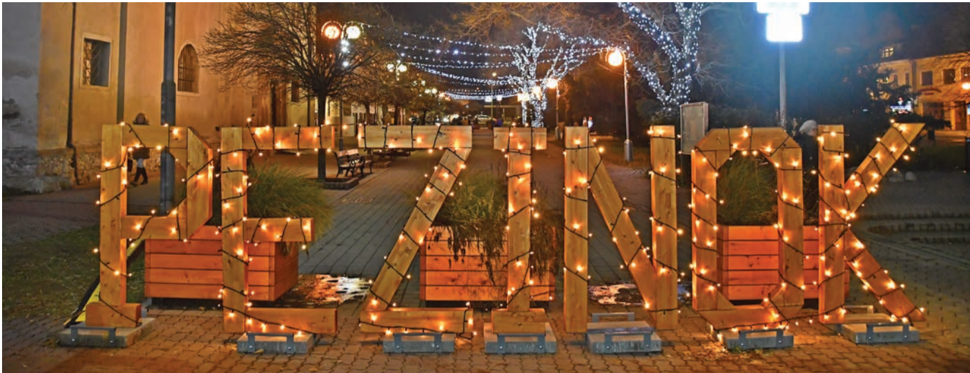
Vianočné osvetlenie na pešej zóne svieti od 1. decembra