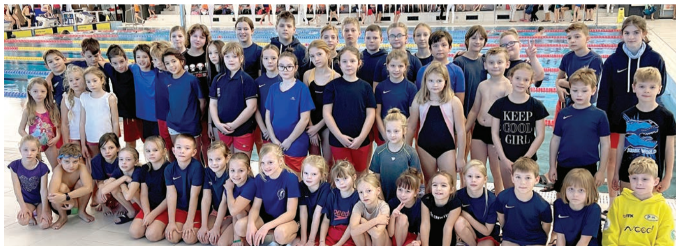
Plavecký klub Pezinok zastupovalo na pretekoch 60 detí