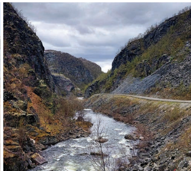
Klesanie do mesta Alta, Nórsko