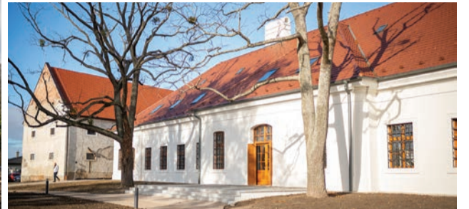
Moderné ekocentrum bude slúžiť odborníkom, školám, žiakom ako aj širokej verejnosti