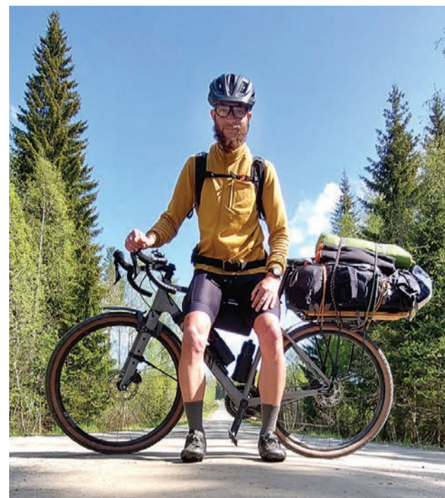
Niekde na ceste do mesta Örnköldsvik, Švédsko

Hovorí sa, že cesta je cieľ, no pre mňa bol cieľom Nordkapp. Tešil som sa na pocit slobody a bezstarostnosti, ktorý pri takýchto dlhých trasách zažívam. Človek nie je rušený myšlienkami a môže sa sústrediť iba na prostredie, ktorým prechádza a ktoré sa mu pred očami mení.