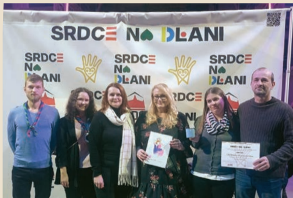
Dobrovoľníci z Občianskej iniciatívy Grinava