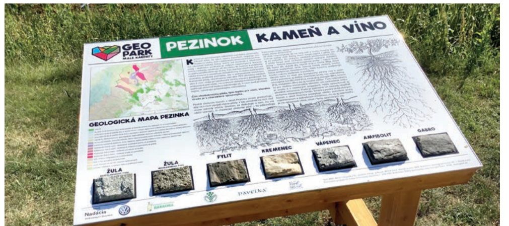
Vzorky hornín vystavené vo vinohradoch nad Pezinkom pri domčeku Celestín