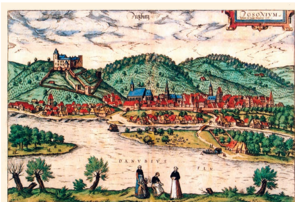
Veduta Bratislavy zo 16. storočia