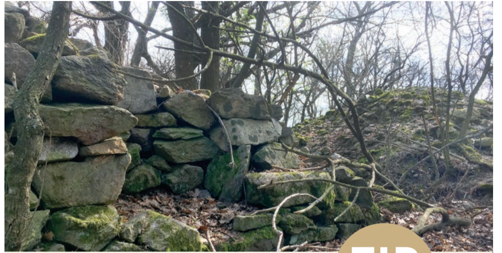
Kamenice vo Svätom Jure

Je zrejme, že toľko služieb nemohli prijať samotní obyvatelia Pezinka, ktorých počet stúpol k r. 1785 na 3 720. V pezinských dielnach pracovali i pre okolité obyvateľstvo, ktoré hojne navštevovalo bohaté pezinské jarmoky.“