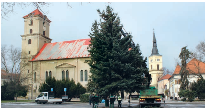
Vianočný strom na Radničnom námestí priviezli a osadili pracovníci Mestského podniku služieb