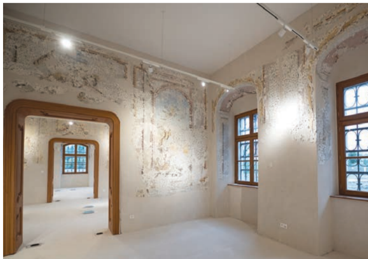
Počas rekonštrukcie boli odkryté vzácne nástenné maľby

Rekonštrukčné práce sú spolufinancované cez Program spolupráce Interreg V-A Slovensko-Rakúsko a revitalizačné práce cez Program spolupráce Interreg V-A Slovenská republika-Maďarsko, prostredníctvom Európskeho fondu regionálneho rozvoja. Ekocentrum Čunovo sa buduje cez prebiehajúce projekty „Ecoregion SKAT“ a „Ecoregion SKHU“, spolu s ďalšími tuzemskými a cezhraničnými partnermi ŠOP SR, DAPHNE - Inštitút aplikovanej ekológie, VODNETURY.sk, NP Donau-Auen (AT), NP Neusiedler See-Seewinkel (AT), Region Marchfeld (AT), Pisztráng kor (HU), obec Kimle (HU), Natúrpark Szigetköz (HU). Náklady na stavebné práce a expozičné priestory dosiahli vyše 4,2 milióna eur.