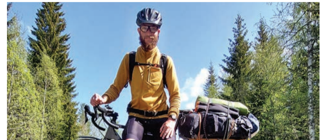
Z Pezinka na Nordkapp prešiel na bicykli dvakrát