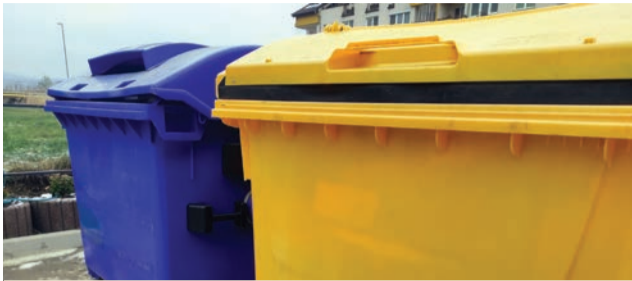
Harmonogram vývozu odpadu 2024