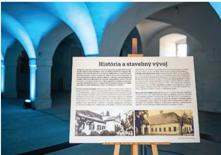
Obnova kaštieľa sa začala v roku 2021