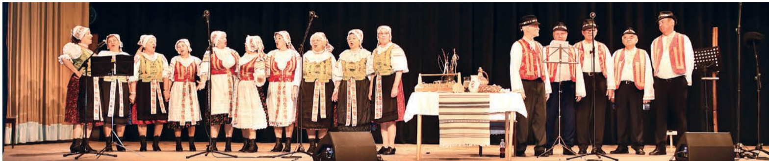
Členovia FSS Radosť odohrali tento rok vyše 20 koncertov

Členovia Folklórneho speváckeho súboru (FSS) Radosť ponúkli svojim priaznivcom koncert Stridzie dni alebo od Kataríny do Vianoc. Hlavnou témou boli zvyky a porekadlá, ktoré sa spájajú s magickými menami predvianočného obdobia.