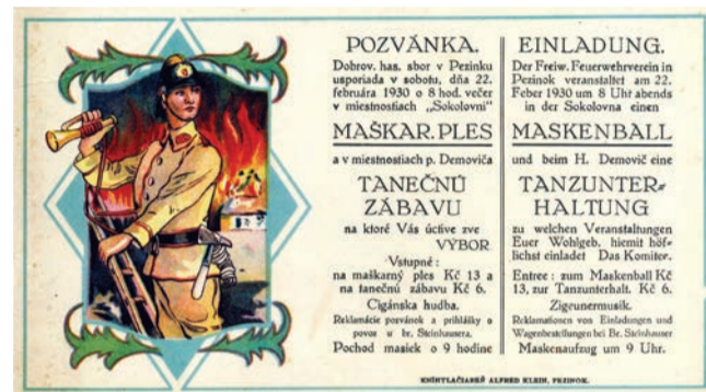
Pozvánka zboru na maskarný ples z roku 1930

Neskoršie spolok premenovali na Dobrovoľný hasičský zbor. Heslo, ktorým sa jeho členovia od začiatku riadili a ktoré majú vyšíť aj na svojej zástave, je: Bohu na slávu – bližnému na pomoc. Počas celej existencie naplnili dobrovoľní hasiči svoje základné humanistické krédo, ktorým bolo zachraňovať a pomáhať, ale aj predchádzať požiarom, nešťastiam a tragédiám.