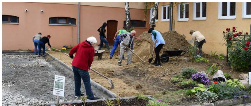
Členovia Denného centra na Kollárovej si svojpomocne vybudovali petangové ihrisko