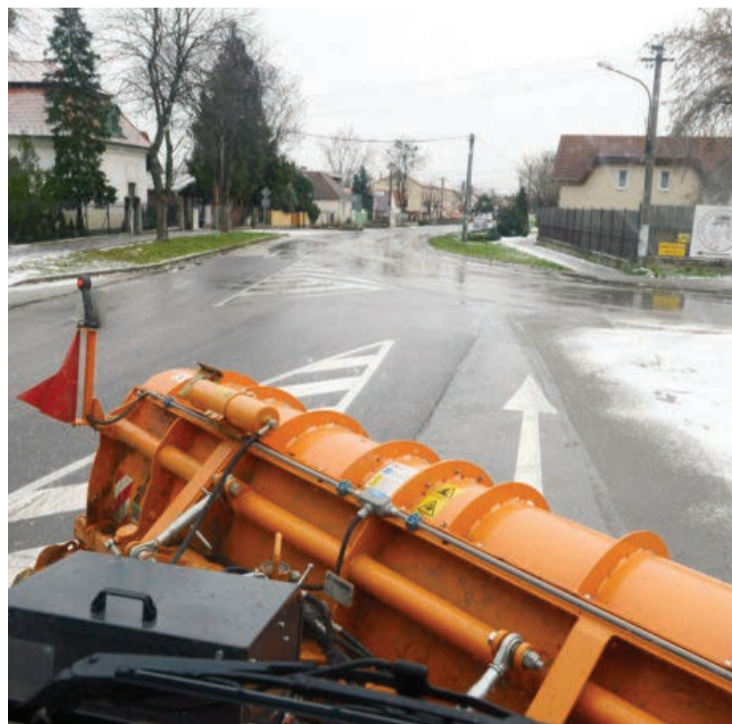
Zimná údržba sa začala 1. decembra, končí 1. apríla 2024