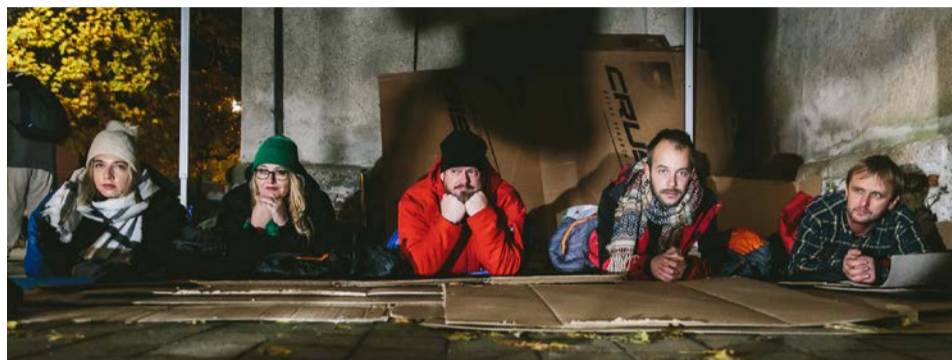
Noc vonku strávilo päť dobrovoľníkov

Aký je život na ulici, si na jednu noc vyskúšali aj dobrovoľníci v Pezinku.