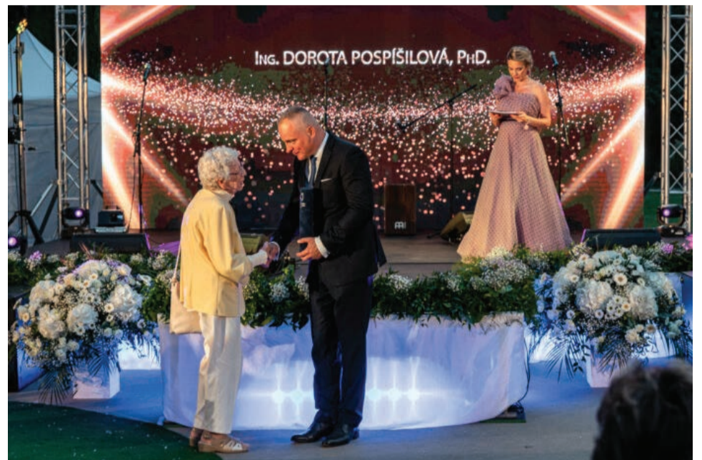
Záber z predchádzajúceho ročníka odovzdávania ocenení