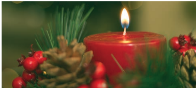
Čarovný advent hlási príchod Vianoc