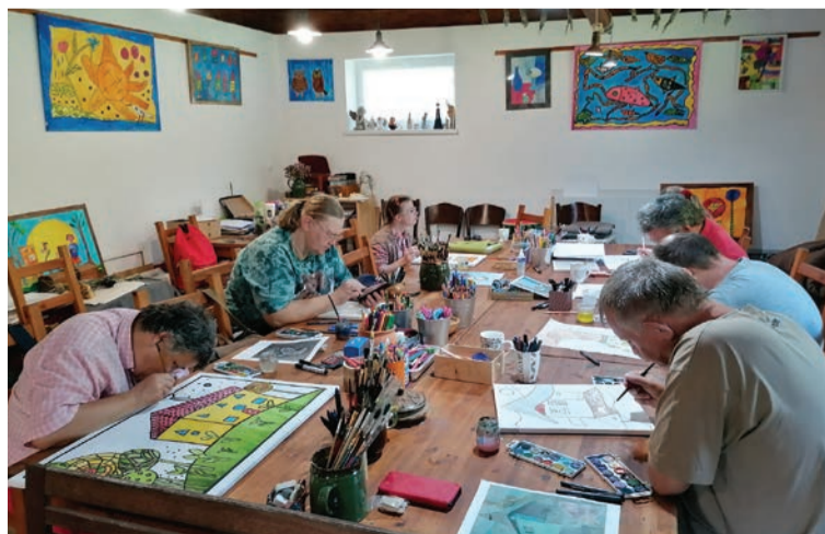
V ateliéri vznikajú jedinečné výtvarné diela

Ateliér ponúka potrebné vybavenie a vzdelávanie vo výtvarných technikách pod vedením špeciálneho pedagóga a arteterapeuta s dlhoročnou praxou v danej oblasti. Výtvarníci sa stretávajú počas školského roka raz do týždňa každý utorok a tvoria rôznymi technikami jedinečné výtvarné diela. Prichádzajú z Pezinka, Bratislavy, Báhoňa, Šenkvic, Harmónie a dokonca až z Nového Mesta nad Váhom. Pravidelne sa zúčastňujú výtvarných prezentácií a súťaží. Svoje obrazy vystavovali s pozitívnym ohlasom viackrát doma i v zahraničí. Návštevníkom výstav sa páčilo hlavne farebné prevedenie obrazov a originálne stvárnenie námetov.