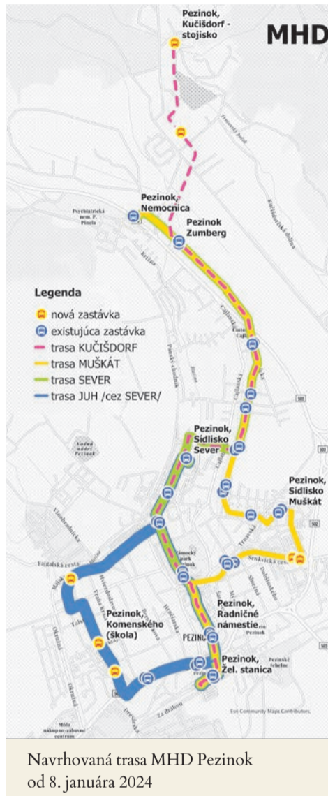
Navrhovaná trasa MHD Pezinok od 8. januára 2024