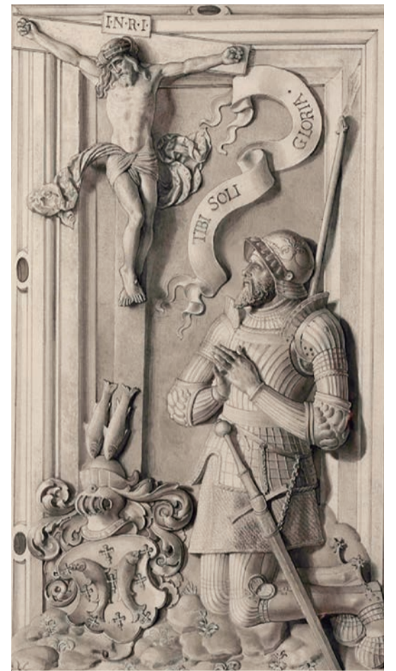
Veko tumbi Mikuláša staršieho zo Salmu

Eck strávil veľkú časť svojho života na bojiskách. Tak ako jeho otec bol rábskym kapitánom (od roku 1560) a kráľovským radcom (od roku 1561). V 70. rokoch sa stal aj zadunajským hlavným kapitánom. V 50. rokoch 16. storočia držal Pajštúnske a Plavecké panstvo, pričom druhé záložoval Fuggerovcom. V roku 1566 sa mu konečne podarilo získať aj Pezinské a Svätajurské panstvo a držal ich do smrti. Jeho hospodárenie však bolo spojené s obrovským zadlžením týchto majetkov a niektoré dlhy, ktoré zanechal, sa amortizovali až začiatkom 17. storočia.