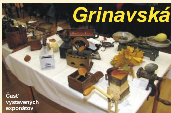
Časť vystavených exponátov

Vážení čitatelia, v tomto čísle chýba širšie spravodajstvo a iné články z dôvodov, že sme poskytli väčší priestor materiálom, ktoré súvisia s komunálnymi voľbami a prezentáciou kandidátov. Aktuálne príspevky zaradíme do budúceho čísla. Ďakujeme za pochopenie. (mo)