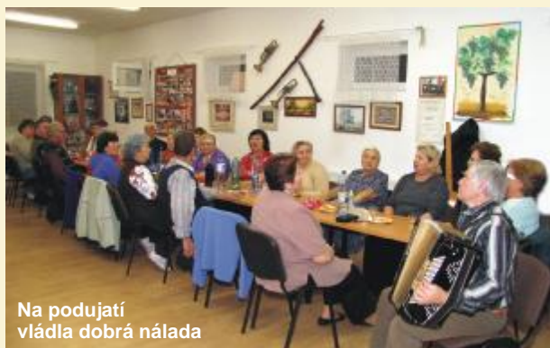
Na podujatí vládla dobrá nálada

Žehličky, petrolejky, mlynčeky, váhy, hodiny, poháre a iné vzácne predmety z dávnych čias sa rozhodli ukázať členovia Základnej organizácie Jednoty dôchodcov Slovenska v Grinave. V rámci ich plodnej činnosti sa zrodil nápad urobiť výstavku, ktorú našiel podporu u väčšiny členskej základne. V mnohých rodinách sa uchováva veľa vzácných vecí, z ktorých dýcha história a ku ktorým sa viažu často nezmazateľné spomienky ich majiteľov. Preto sa ich neradi vzdávajú a strážia ich ako oko v hlave. Tieto veci priniesli viacerí na pravidelné dvojtyždenné členské stretnutie a dlhý čas sa na nich spoločne kochali. Škoda len, že vzácnu výstavku pod názvom Z babičkinho šuflíka, si nemohli pozrieť aj iní občania, keďže priestory grinavského Integrovaného klubu sa využívajú aj na iné činnosti. (mo)