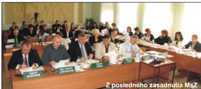
Z posledného zasadnutia MsZ