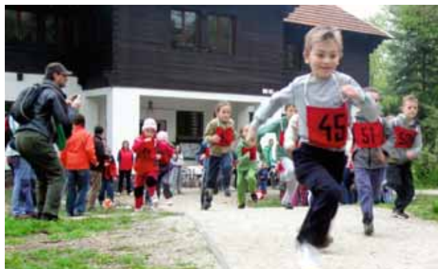
Najmladší účastníci behu mesta Pezinok

Štrnásteho apríla sa za účasti 77 pretekárov uskutočnil 34. ročník Behu mesta Pezinok.