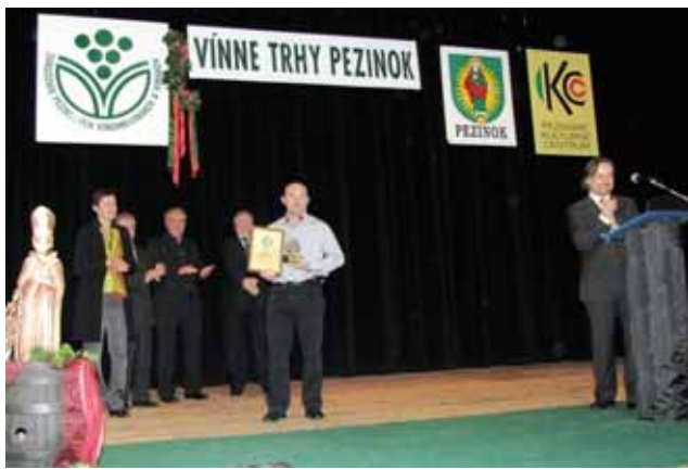
Oceňovanie najúspešnejších vinárov.

Vína boli zaradené do siedmich kategórií. V každej bol vyhlásený Šampión - toto ocenenie je najvyšším ocenením na výstave. V 1. kategórii - Víno biele, tiché, suché - Šampióna získal SAUVIGNON, výber z hrozna, r. 2011 výrobcu VINO MRVA & STANKO Trnava. V 2. kategórii - Víno biele, tiché, polosuché, polosladké , do 45 g