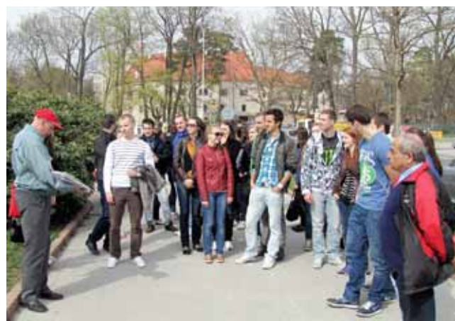
Študenti bratislavskej EU s mestským sprievodcom na Štefánikovej ulici.