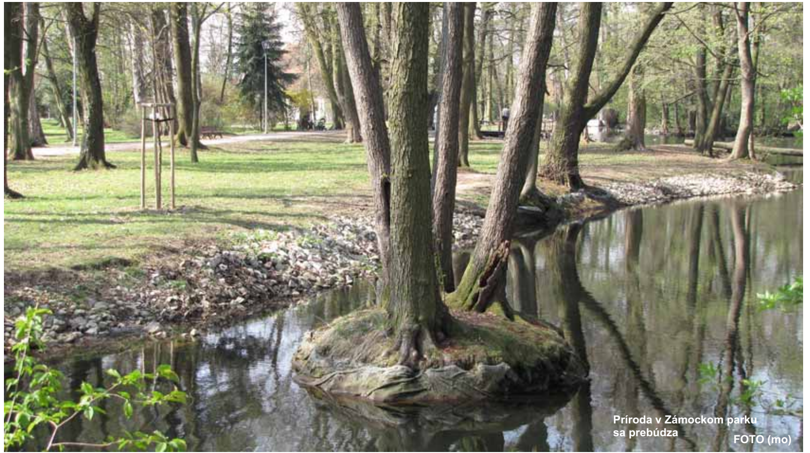
Príroda v Zámockom parku sa prebúdzá