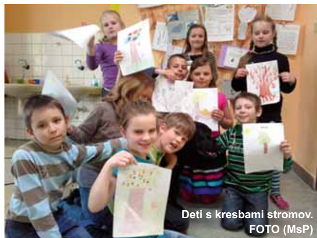
Deti s kresbami stromov.

Deti počas hodiny počúvajú rozprávku preventistu, popri tom kreslia samých seba ako zázračný strom a do kresieb vkladajú svoje pocity a hodnoty, o ktoré v rozprávke ide. Rozprávka s názvom „O zázračných stromoch“ totiž vznikla len kvôli tejto novej aktivite, ktorej cieľom je eliminácia šikanovania a narušených vzťahov v tri-