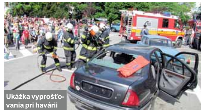
Ukážka vyprošťovania pri havárii