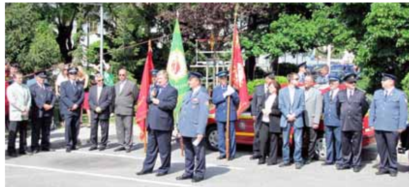
Otvárací ceremoniál na Radničnom námestí.