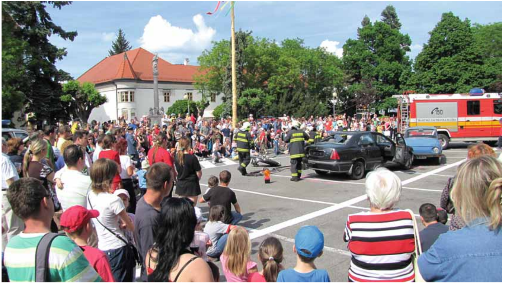
Aj na tohtoročné oslavy sv. Floriána prišlo veľa ľudí. Na Radničnom námestí si mohli pozrieť ukážky z práce profesionálnych i dobrovoľných hasičov, policajtov a zdravotníkov. Program bol doplnený o viacero sprievodných akcií. Čítajte článok na 9. strane.

Okresné riaditeľstvo Policajného zboru – Okresný dopravný inšpektorát vydal povolenie na uzávierku miestnej komunikácie – ulice Panský chodník (tzv. Alej v smere od Suvorovovej po Krížnu a Kutuzovovu ul.) z dôvodu generálnej rekonštrukcie. Uzávierka potrvá v termíne od 10. mája do konca septembra. O priebehu prác budete pravidelne informovať. Popri novej ceste tu bude vybudovaný aj súbežný zelený pás, chodník a verejné osvetlenie. Práce realizuje firma I.M.D. Group II. s.r.o. so sídlom v Pezinku. (pv)