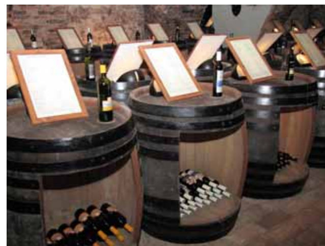
Oloženie vybraných vín v Národnom salóne vín v pezinskom zámku.

Podmienkou pre zaradenie vybraného vína do Salónu vín je, aby výrobca mal k dispozícii 500 litrov prihláseného vína. Za kaž-