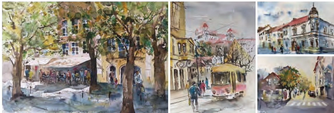
Pezinok a okolie z tvorby Michaely Syrovej. Výstava V objatí krajiny potrvá od 4. apríla do 2. júna