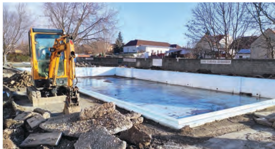
Rekonštrukcia plaveckého bazéna sa začala v januári