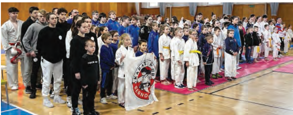
Slovenský pohár v karate a kobudo sa začal v Pezinku, pokračuje v Púchove

Slovenský pohár v karate a kobudo sa už tradične začal v Pezinku. Prvé kolo sa konalo v sobotu 3. februára v športovej hale na Komenského. Organizáciu zabezpečil Karate-kickbox klub Pezinok.