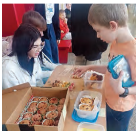
Kúpou valentínskeho koláčika mohli žiaci pomôcť deťom v núdzi