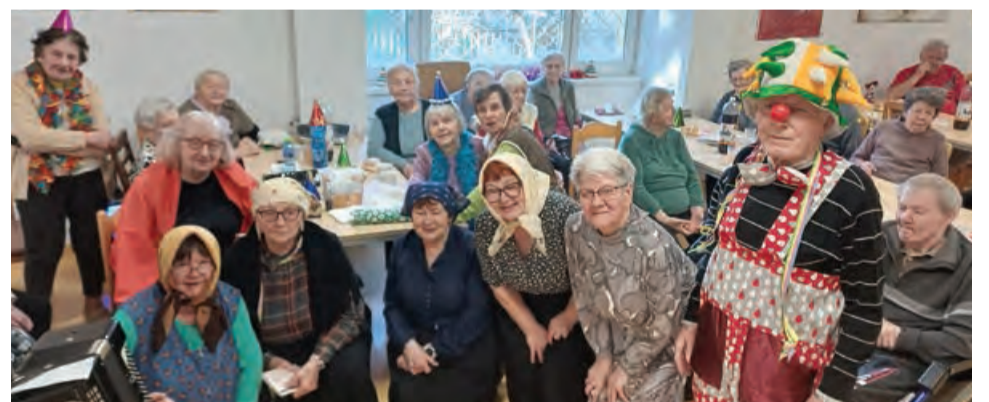
Klienti centra oslávili fašiangy s členmi súboru Obstrléze