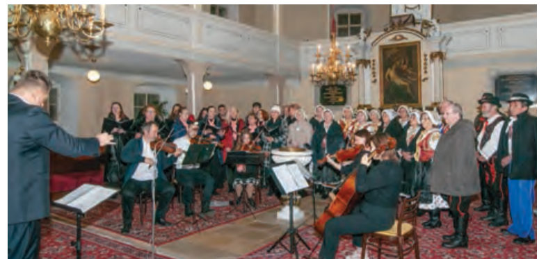
Lions klub pomáha ľuďom v núdzi