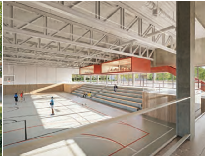
Vizualizácia športovej haly