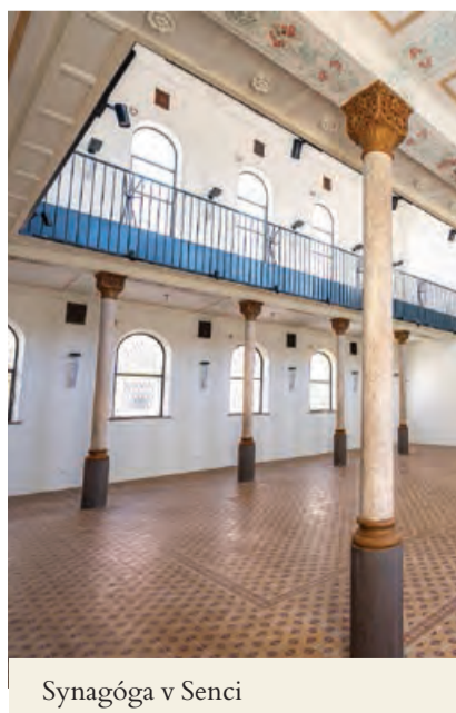
Synagóga v Senci

Samosprávny kraj tento rok po úspešnej rekonštrukcii otvorí synagógu v Senci ako kultúrno-umelecké centrum. Začína tiež s prípravnými prácami, výsledkom ktorých bude rekonštrukcia synagógy vo Svätom Jure a pietneho miesta