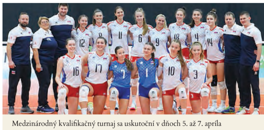
Medzinárodný kvalifikačný turnaj sa uskutoční v dňoch 5. až 7. apríla