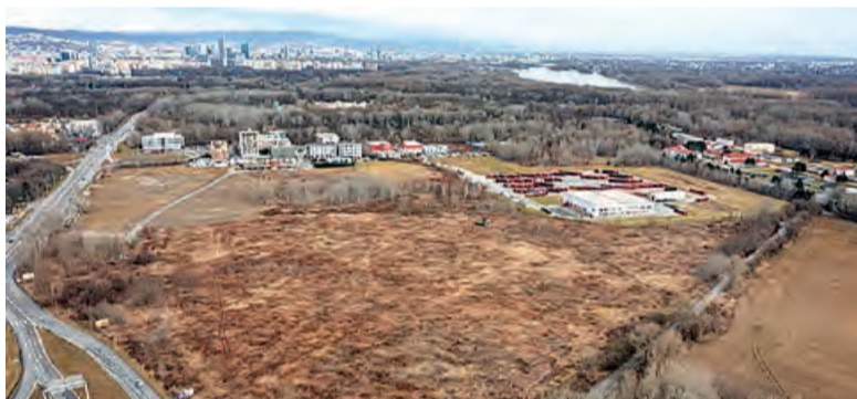
Areál kampusu zdravia a športu

BSK plánuje v rámci mestskej časti Petržalka vybudovať modernú štvrť pre potreby vzdelávania a aplikovaného výskumu v oblasti zdravia a športu.