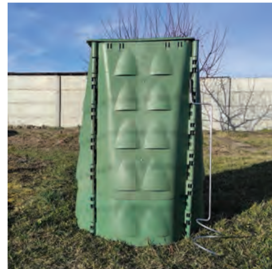
Prvé kompostéry (78 x 109 cm) boli záujemcom odovzdané 14. februára