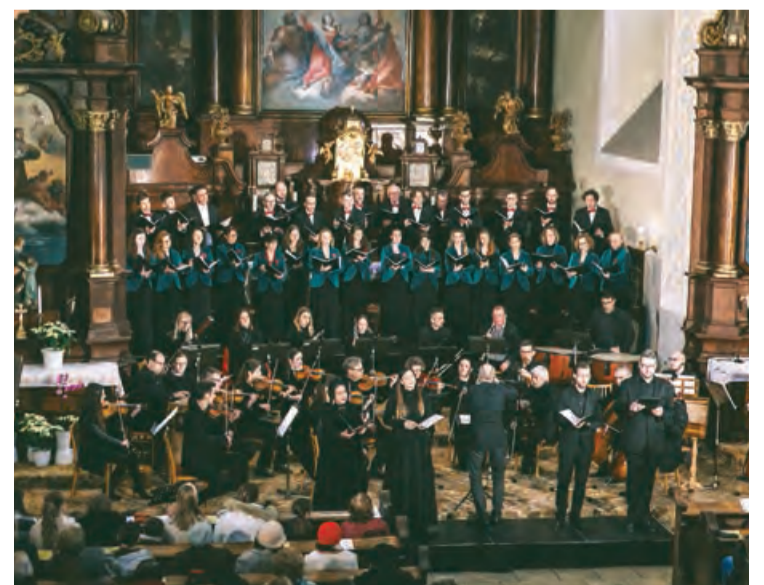
Benefičný koncert Cesty k sebe v kláštornom kostole v Pezinku