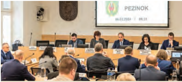
Poslanci schválili rozpočet