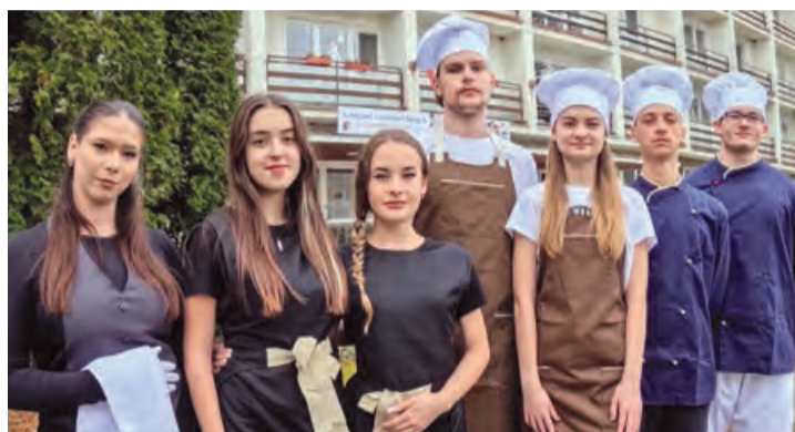
Študenti Strednej odbornej školy podnikania a služieb

Žiaci majú možnosť už počas štúdia získavať praktické zručnosti v predmetoch zručnosti pre úspech, cvičná firma či aplikovaná ekonomia. Spolupracujeme s Junior Achievement Slovensko a od školského roka 2023/2024 sme súčasťou FinQ – programu finančného vzdelávania a rozvoja finančnej kultúry školy. Žiakom ponúkame už počas štúdia aj široké možnosti mimoškolských aktivít a priestor na rozvíjanie ich osobností. Opakovane sme získali od UNICEF-u titul Škola priateľská k deťom. Tí, ktorí majú záujem, môžu na sebe pracovať a získať titul DofE – Medzinárodnú cenu vojvodu z Edinburghu.