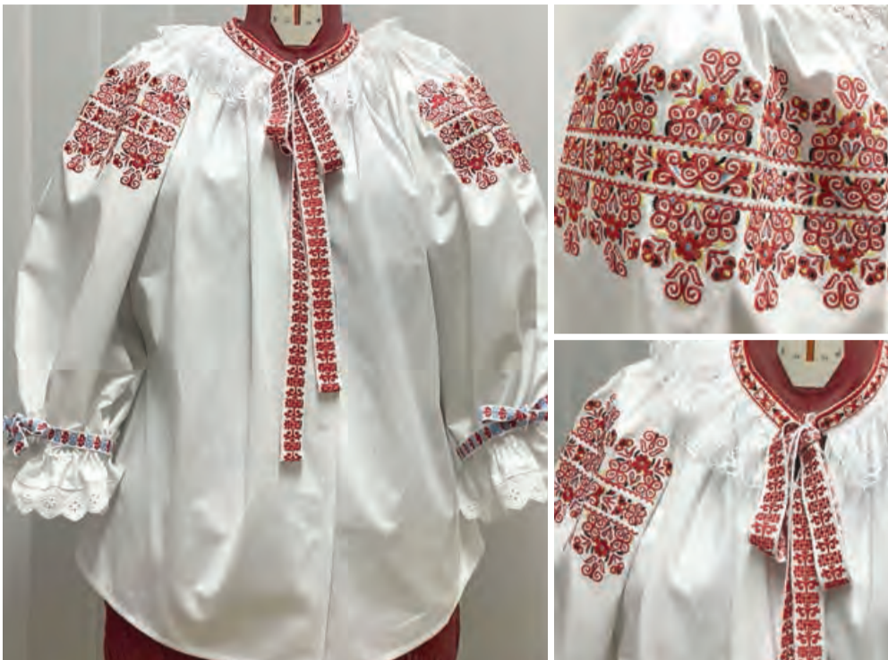
Nové krojové rukávce sú bohato zdobené