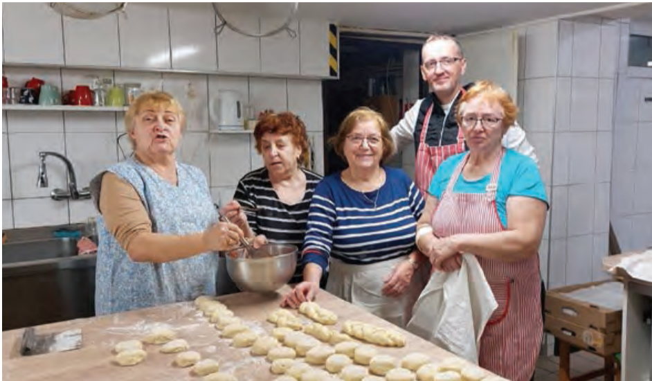
Súčasťou aktivít cajlanského klubu počas fašiangov je pečenie šišiek

V Klube dôchodcov na Cajlanskej ulici sa konala výročná členská schôdza, ktorej predmetom bolo zhodnotenie činnosti v roku 2023.