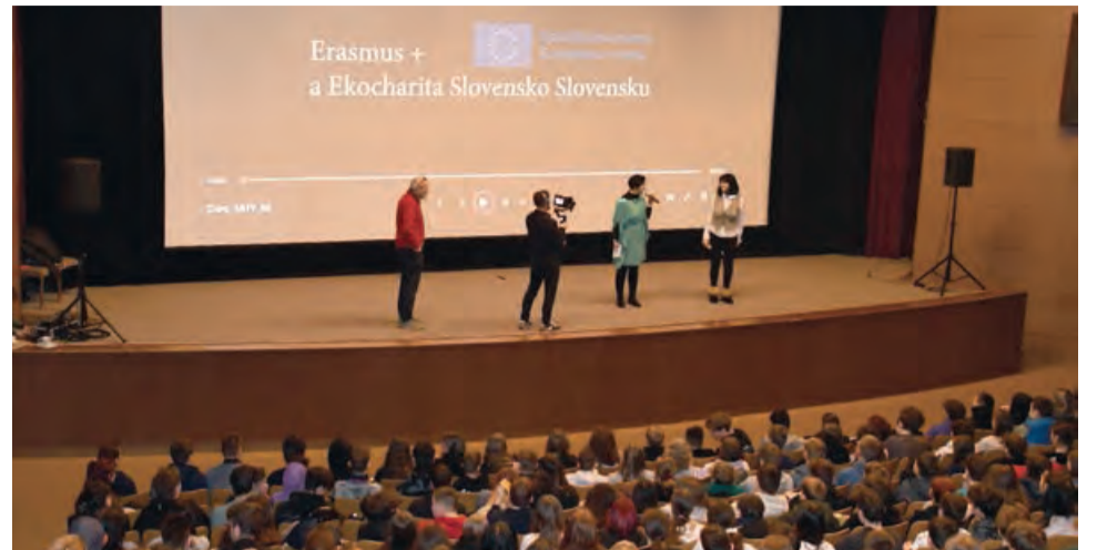
Film sa natáčal v kinosále Domu kultúry