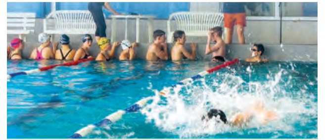
Mesto pozýva na plavecký maratón