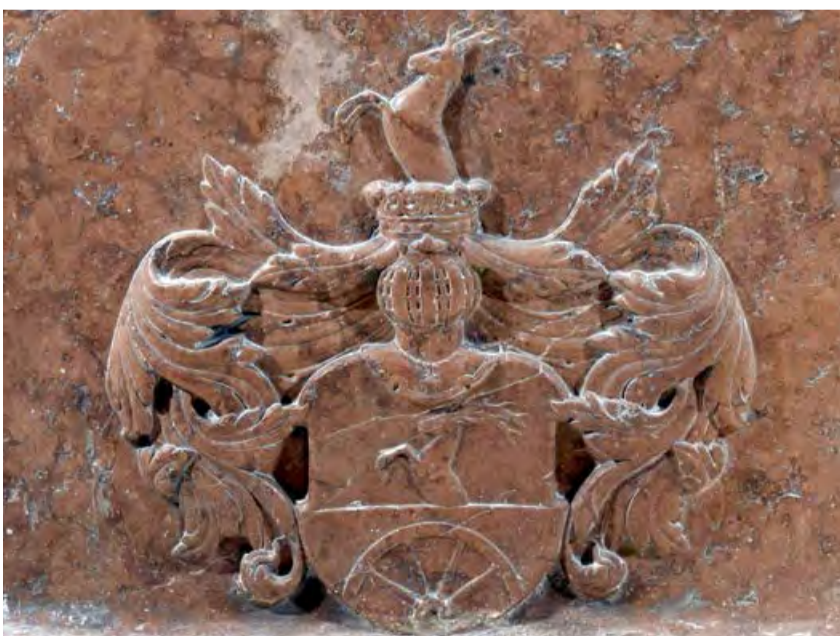
Detail páfiovského erbu z náhrobku Tomáša Pálfiho nachádzajúceho sa vo farskom kostole v Pezinku

Helena Gahérová, Mestské múzeum v Pezinku