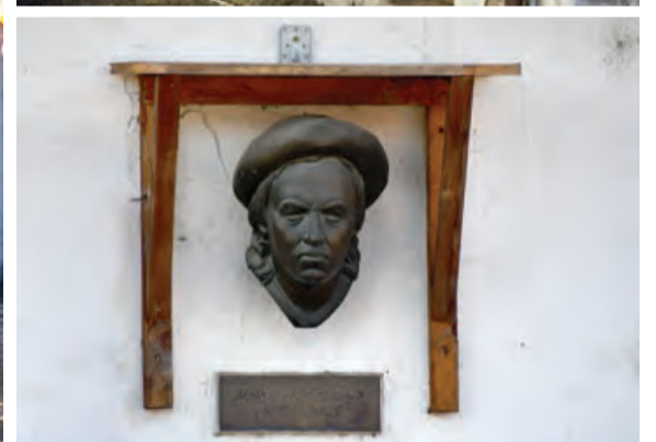
Rodný dom Jána Kupeckého sa nachádza na Kupeckého ulici č. 39. Na jeho uličnej fasáde je umiestnená pamätná tabuľa a bronzová busta umelca