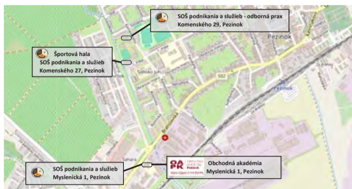
Budovy sa nachádzajú v jednej lokalite Pezínka