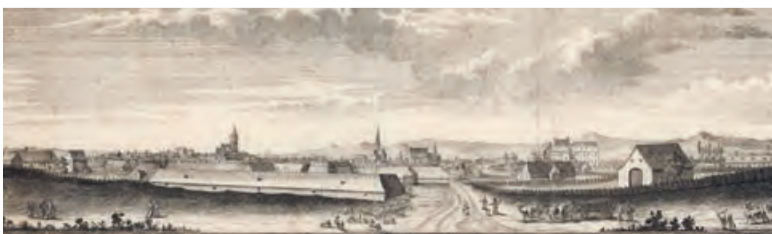
Veduta Pezinka v Notíciách Mateja Bela, grafika Abrahama Kaltschmidta a Samuela Mikovíniho, 1736