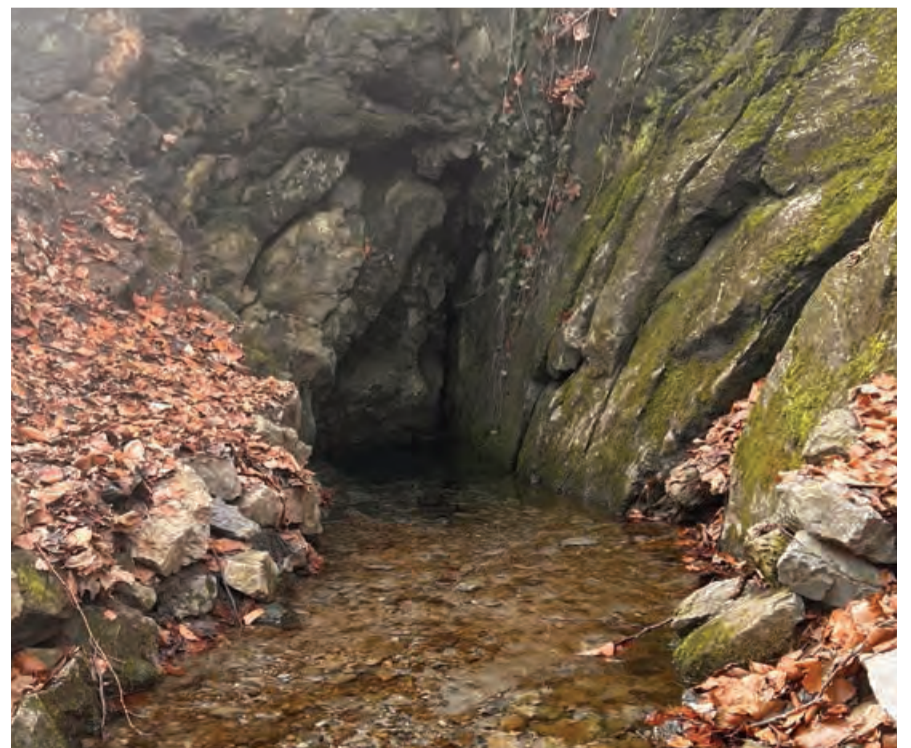
Limbašská vyvieracka je jedno z najzaujímavejších miest v Malých Karpatoch