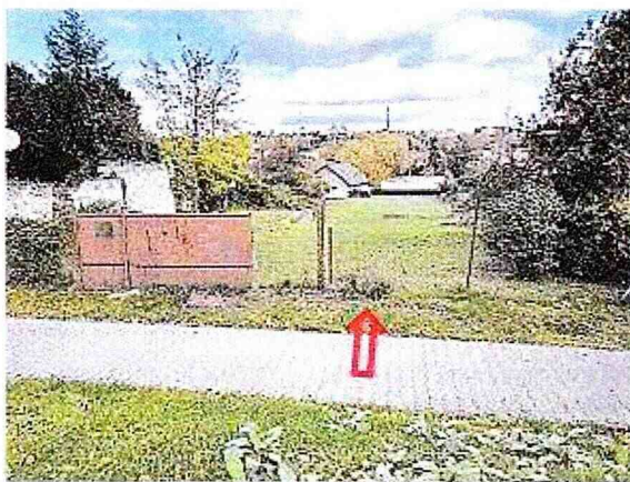
Pohľad na pozemky parc. č. 158, 159 od ulice Chorvátska