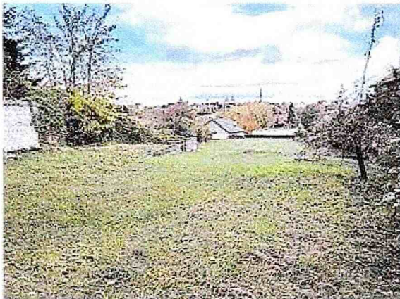
Ohodnocované pozemky parc. č. 158, 159