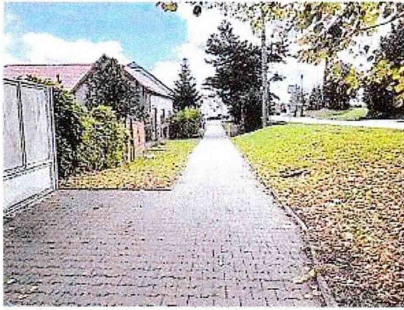
Pohľad na prístupovú komunikáciu