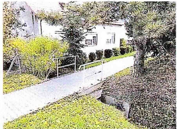
Mostík cez odvodňovací kanál, ktorý vedie pozdĺž juhovýchodnej hranice pozemkov parc. č. 158, 159