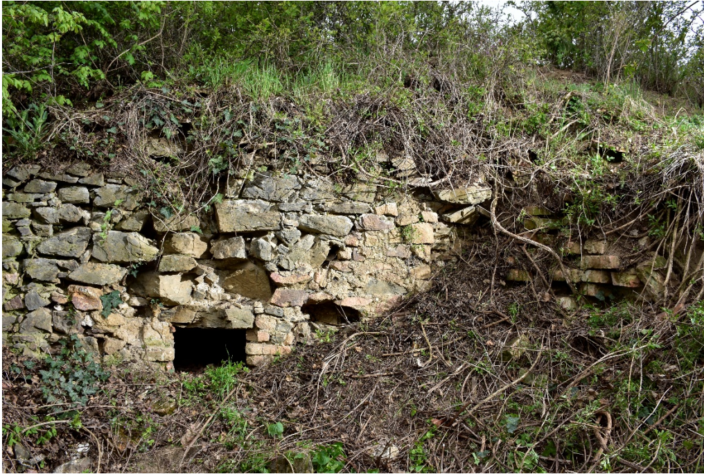
c) Chránená zeleň na území mesta Pezinok: