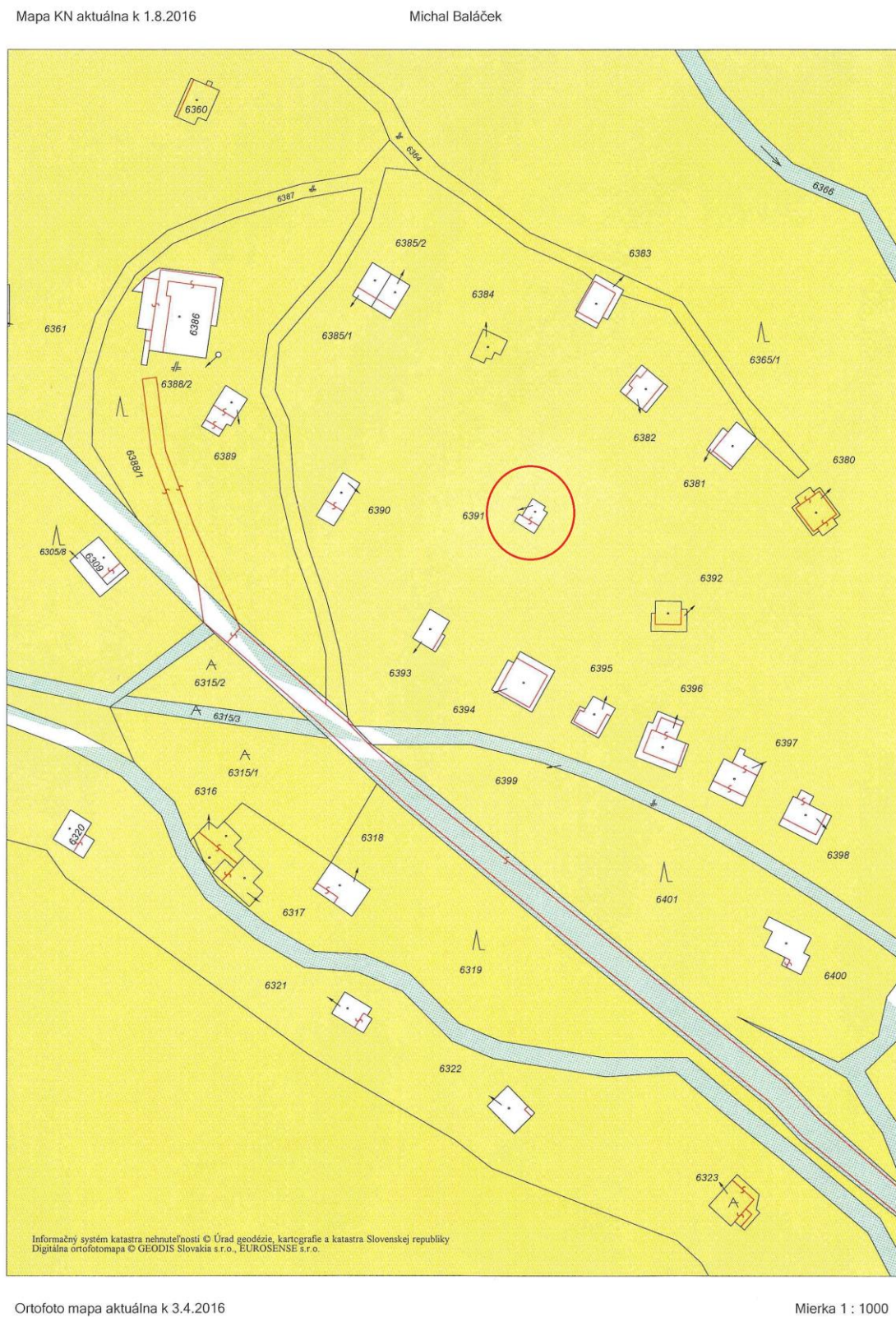
Obr. č. 1: Výrez z katastrálnej mapy.