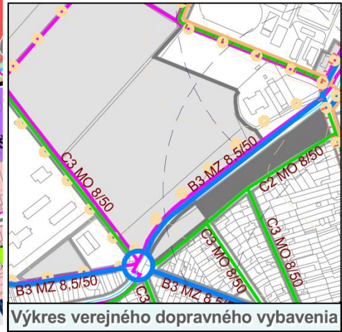
Výkres verejného dopravného vybavenia