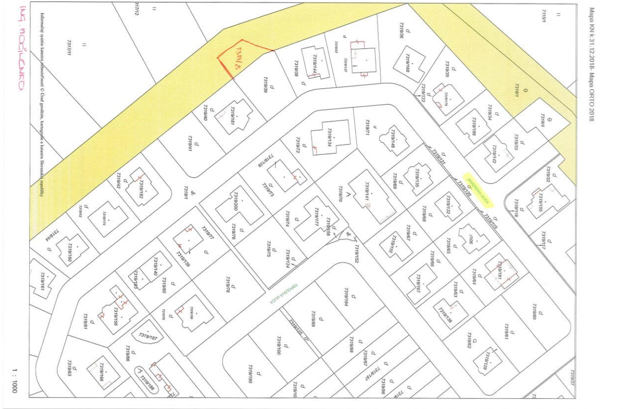
Obr. č. 2: Ortomapa.