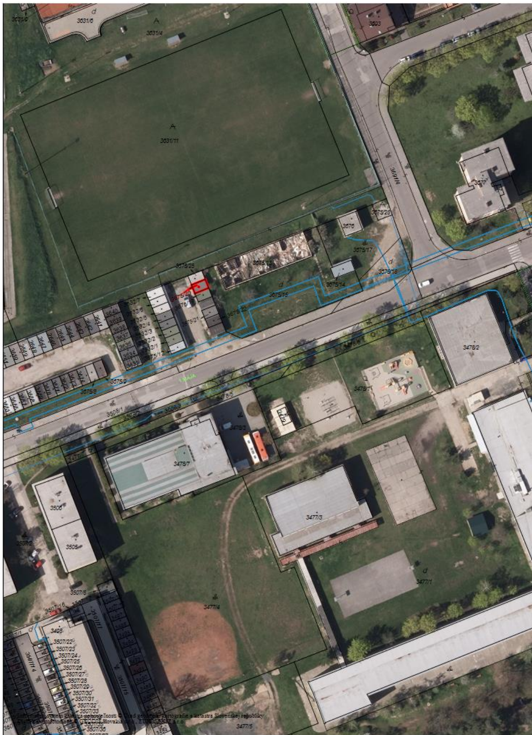
Obr. č. 2: Ortomapa.