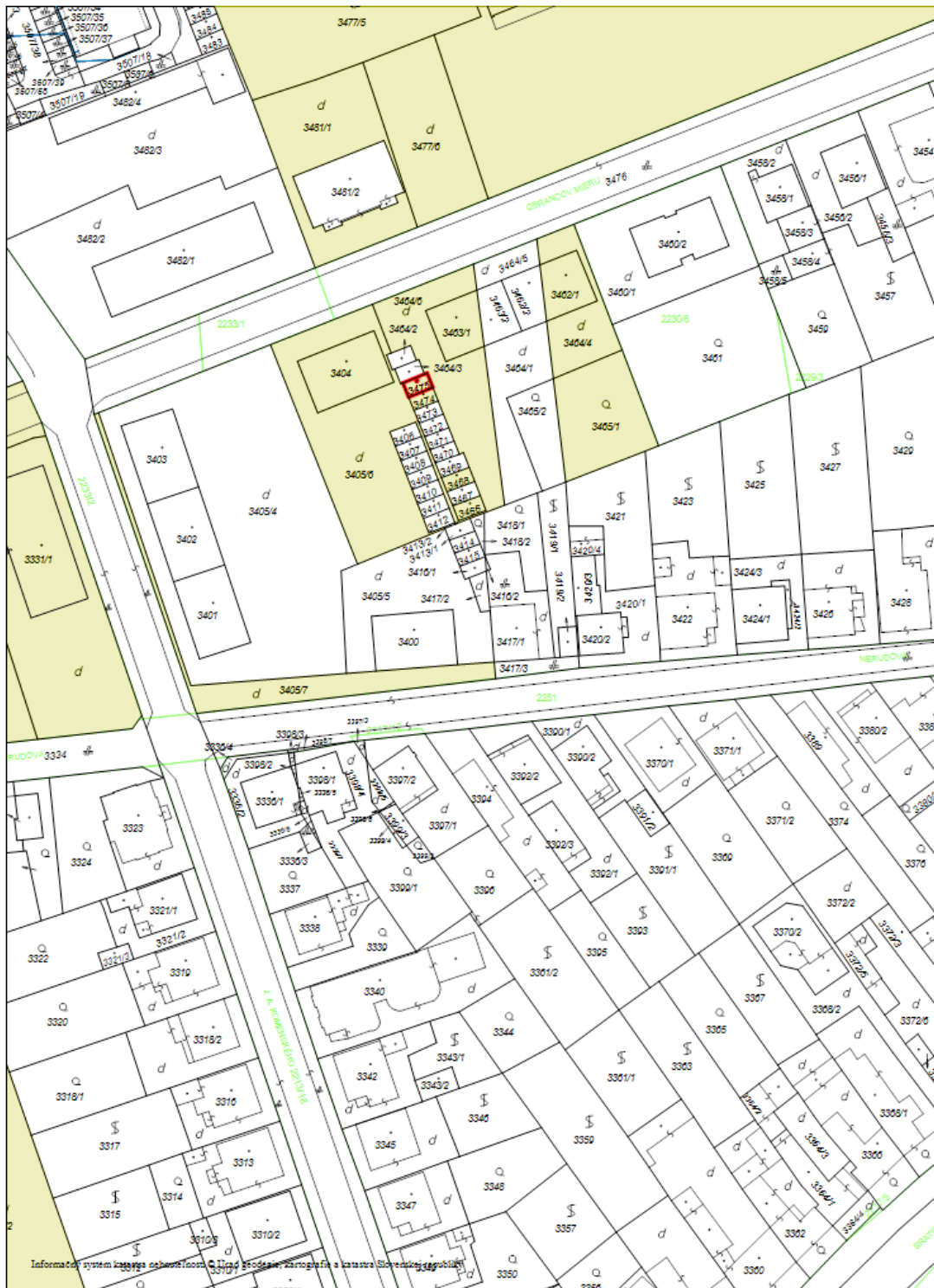
Obr. č. 1: Výřez z katastrální mapy.