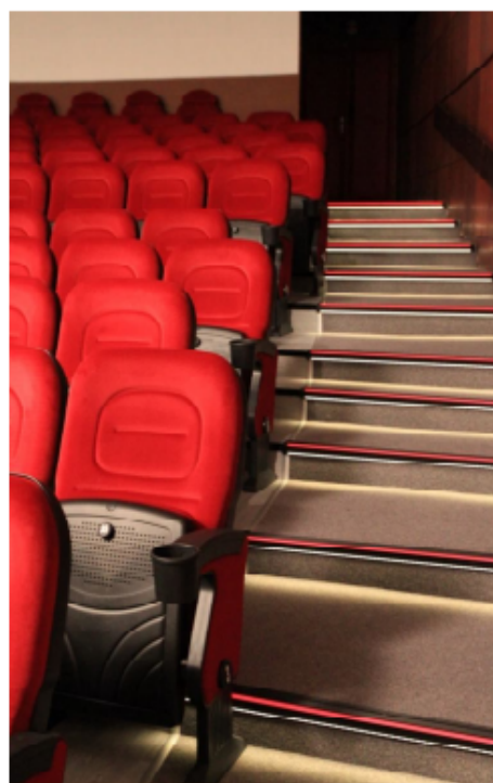
Ukážka LED osvetlenia schodiska v kine v Topoľčanoch