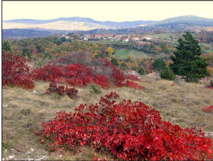
Kras v jeseni