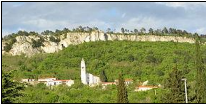
Z kopca do mora