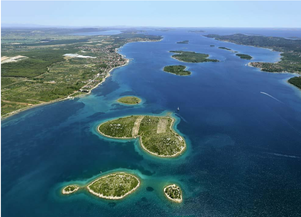
Pašmanski kanal - prieliv

Ostrov Pašman a Ugljan sa rozprestierajú neďaleko miest Zadar a Biograd. Zároveň patria do tzv. skupiny Severodalmatských ostrovov. Od pevniny ich delí Pašmanský prieliv.