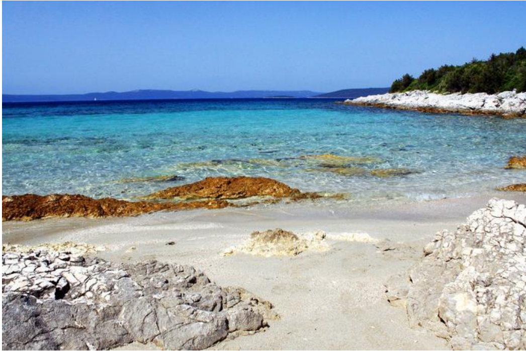
Jedna z pláží na našej ceste po ostrovoch Pašman a Ugljan