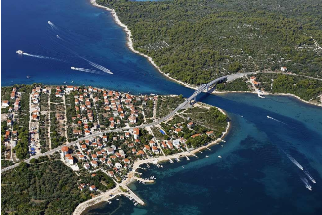
Most medzi ostrovmi Pašman a Ugljan

Od susedného ostrova Ugljan bol kedysi Pašman doslova naskok. V 70. rokoch 20. storočia bol tamjší prieplav prehĺbený a rozšírený. Vznikol tu vysoký most s podjazdovou výškou 16 m a silný prúd vody má rýchlosť 4 uzly.